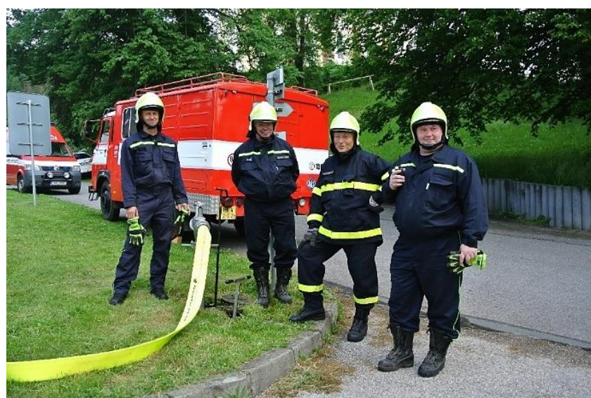
Hasičské cvičení Batňovice, rok 2019