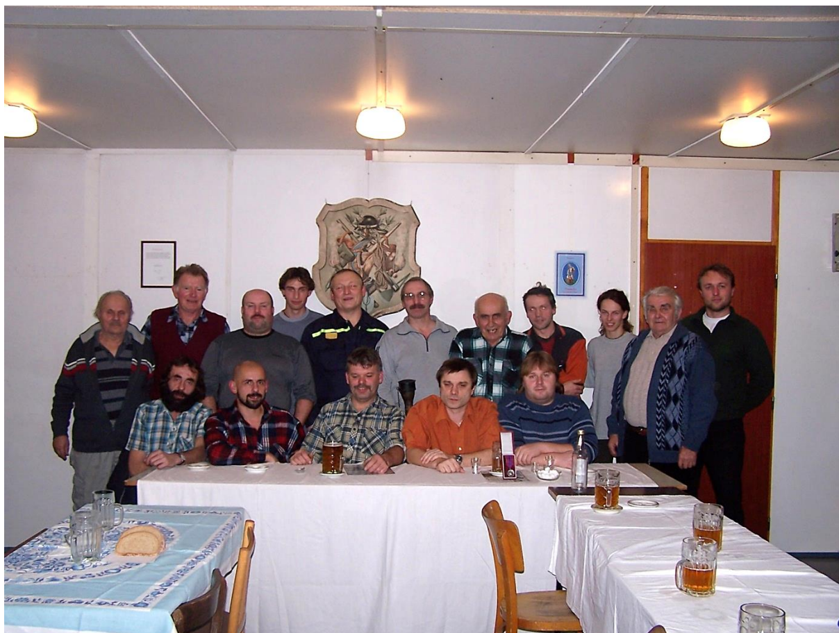
Fotografie z výroční valné hromady, rok 2008