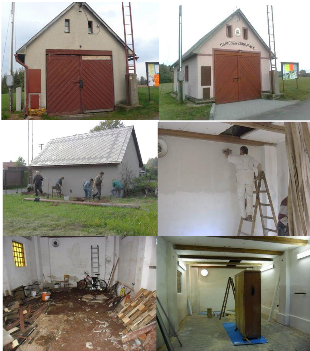
Oprava hasičské zbrojnice, rok 2013