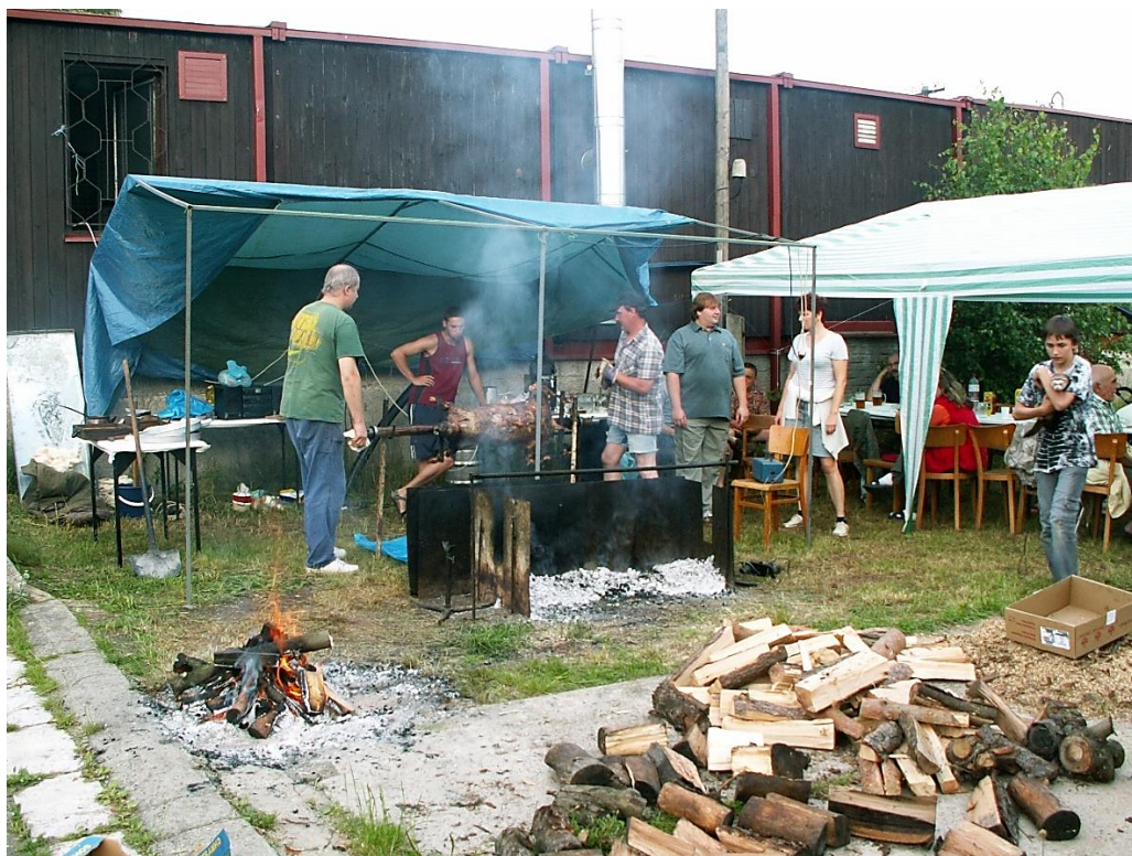
Opékání jehněte, rok 2009