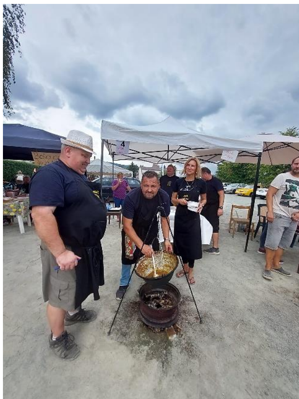
Gulášfest Batňovice, rok 2022