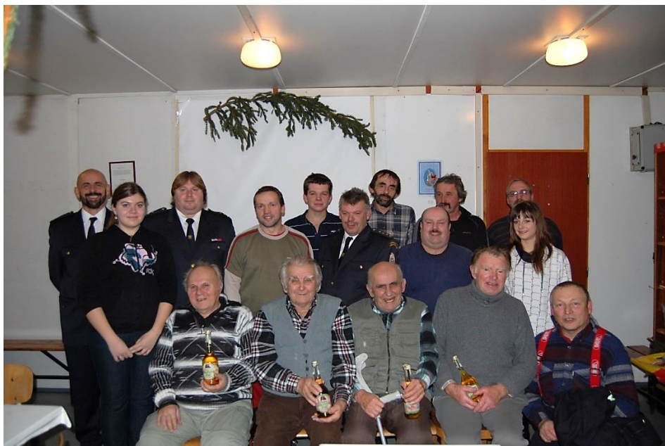
Fotografie z výroční valné hromady, rok 2011