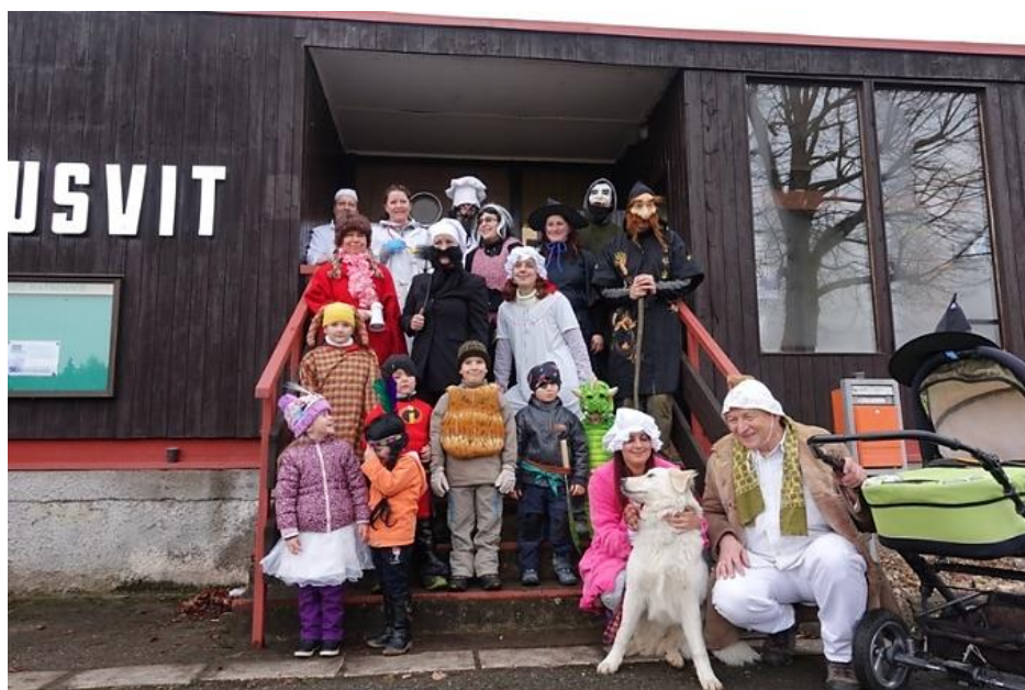
Masopustní průvod a následné posezení v Úsvitu, rok 2016