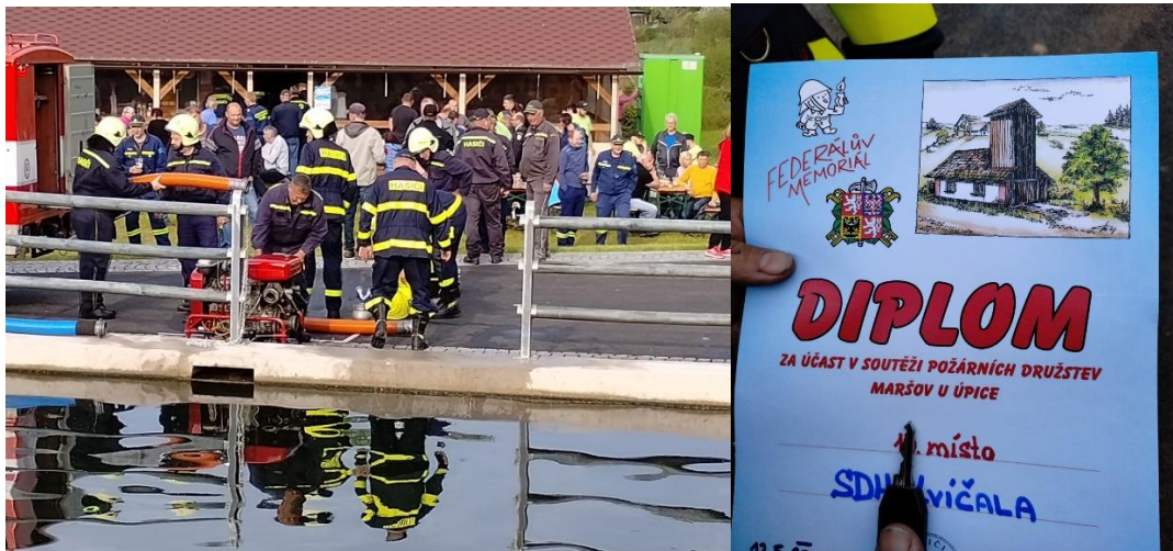
Federálův memoriál Maršov u Úpice, rok 2003