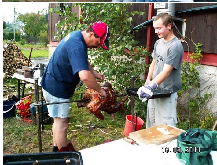
Fotografie z opékání kuřat a krůty, rok 2011