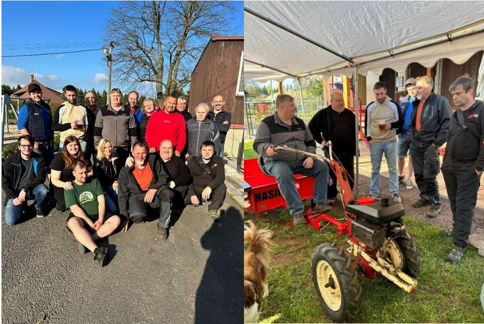
Oslava velitelových narozenin, rok 2023