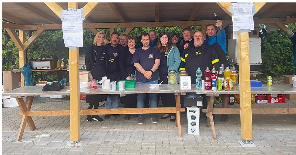
Koletova Rтынě, rok 2023