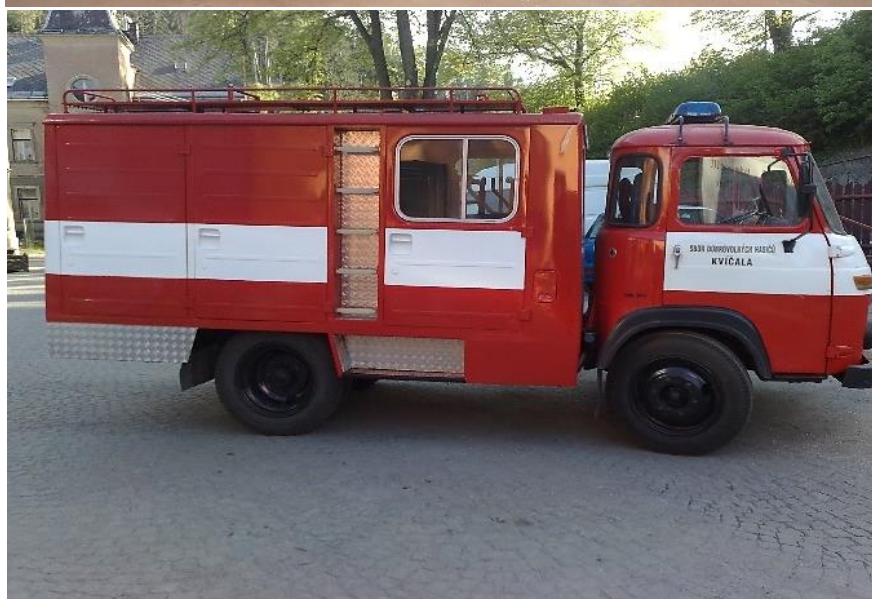
Fotografie z opravy Avie, rok 2011