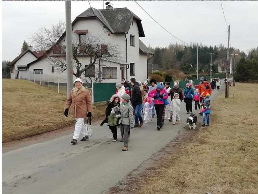
Masopust, rok 2019