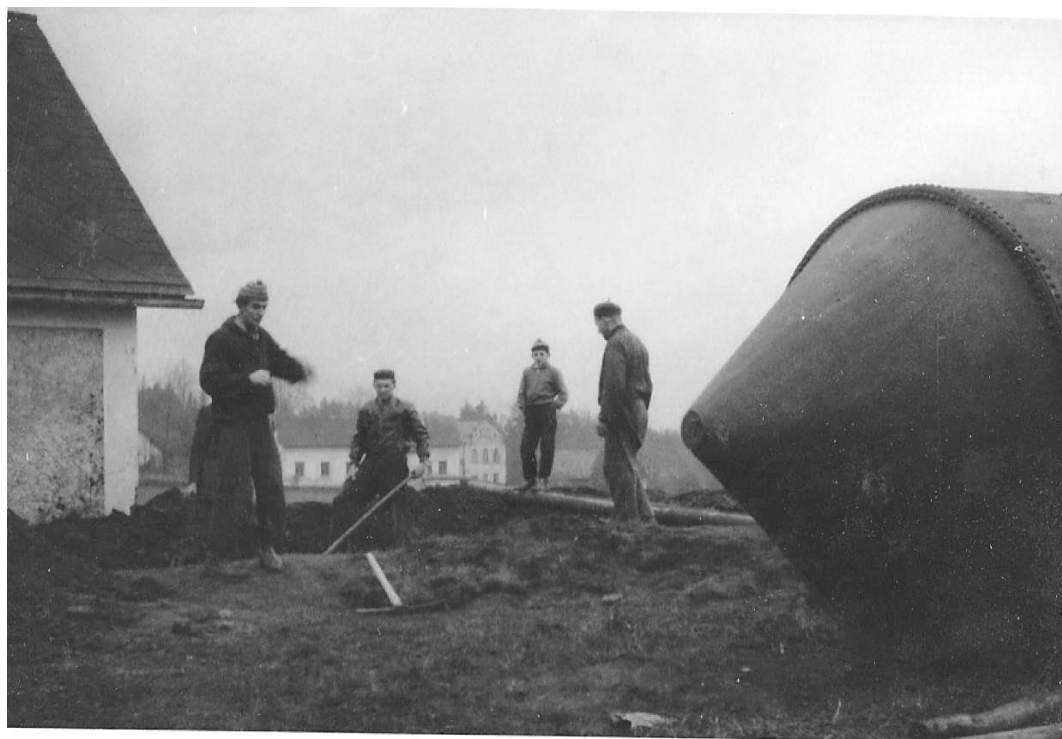
Zakopání nádrže na vodu do země vedle hasičárny, rok 1959