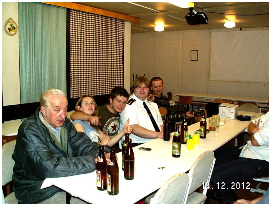
Výroční valná hromada, rok 2012