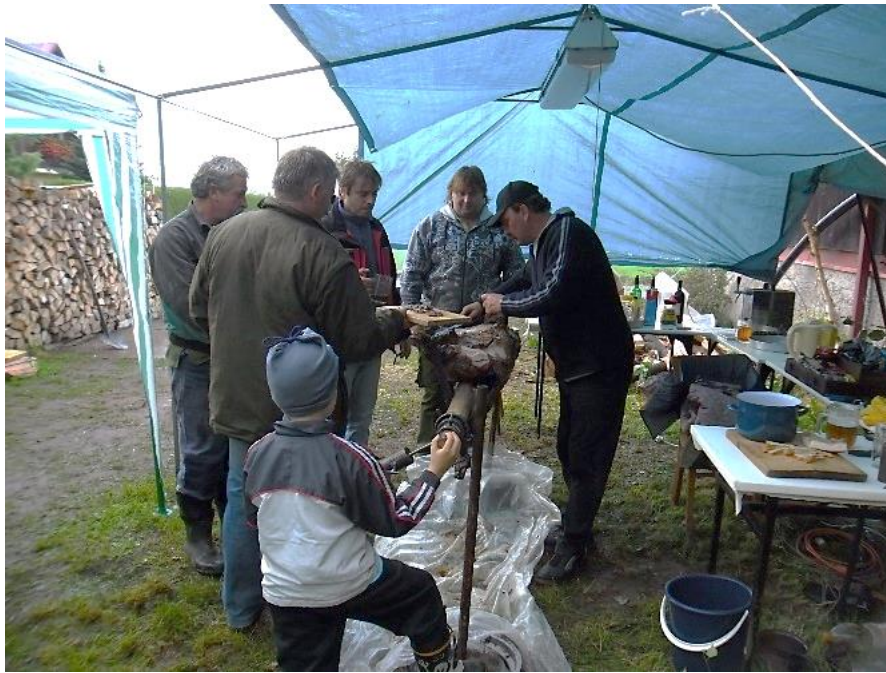
Grilování divočáka, rok 2012