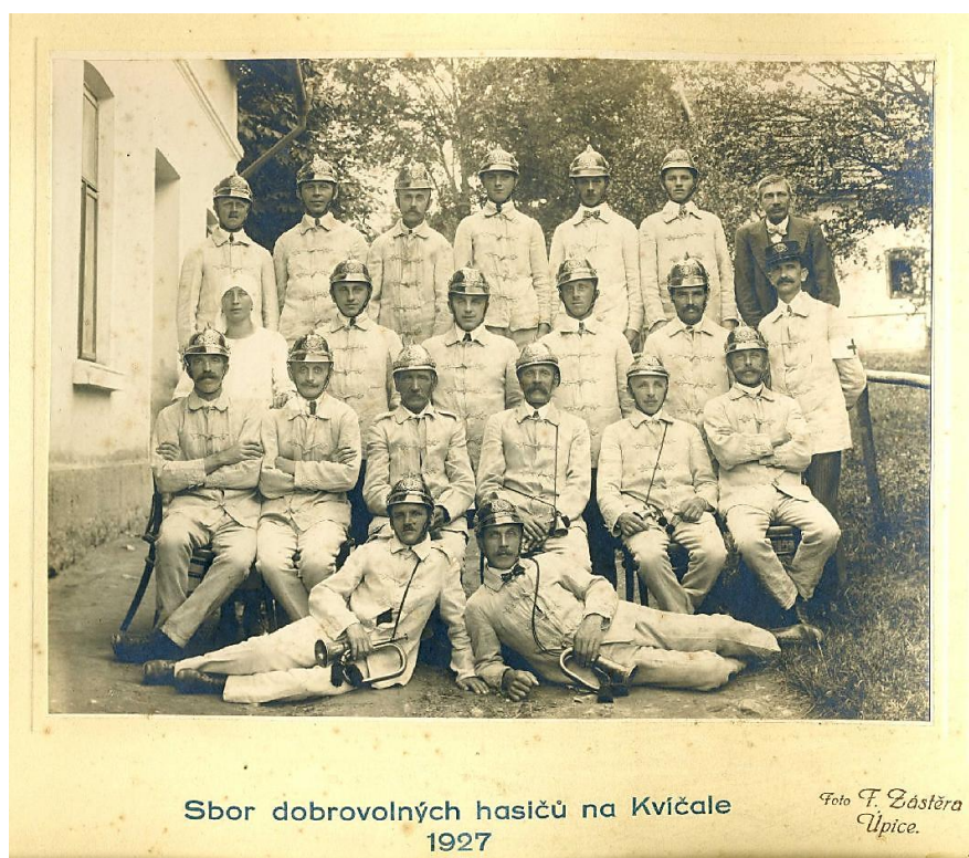
Dobová fotografie členů sboru dobrovolných hasičů ze 7. srpna 1927.