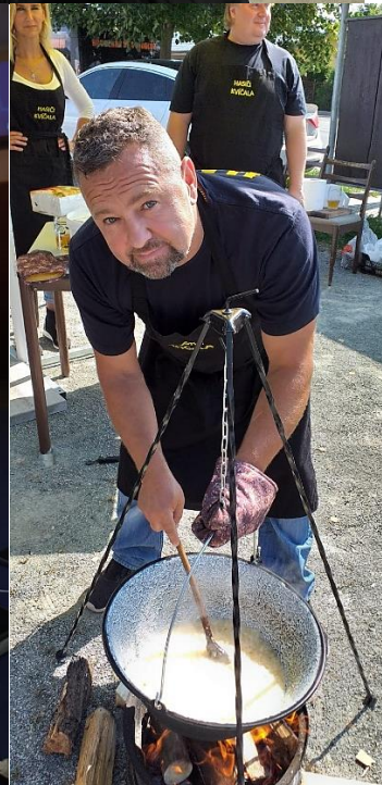
Gulášfest Batňovice, rok 2021