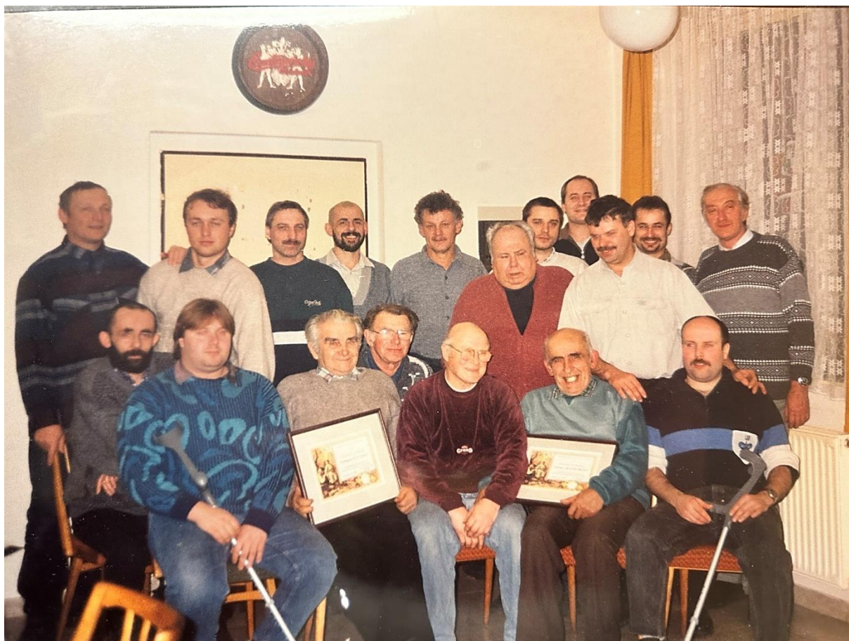
Fotografie z výroční valné hromady konané ve Velkých Svatoňovicích, rok 2000.