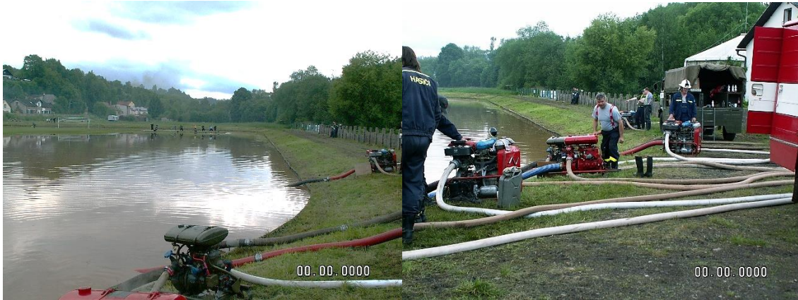
Pomoc s odsáváním vody na zatopeném fotbalovém stadionu Sparta v Úpici, rok 2013