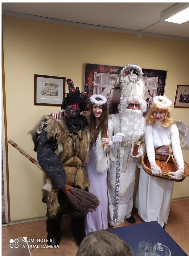
Mikulášská besídka, rok 2022