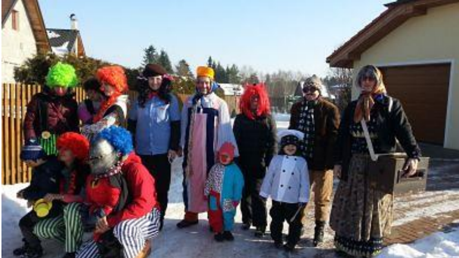
Masopustní průvod, rok 2015