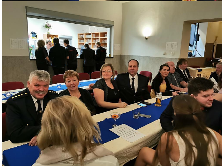
Ples Žďár nad Metují, rok 2020