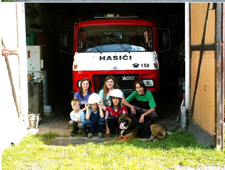
Fotografie z dětského dne a setkání rodáku, rok 2010