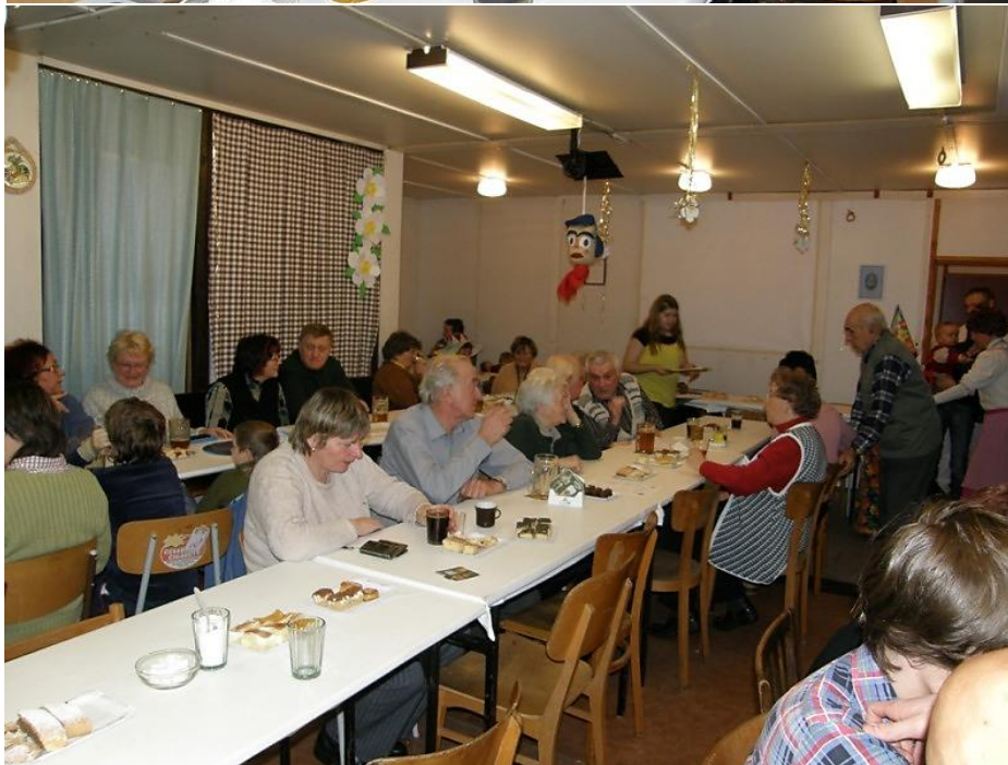
Fotografie z masopustu, rok 2010