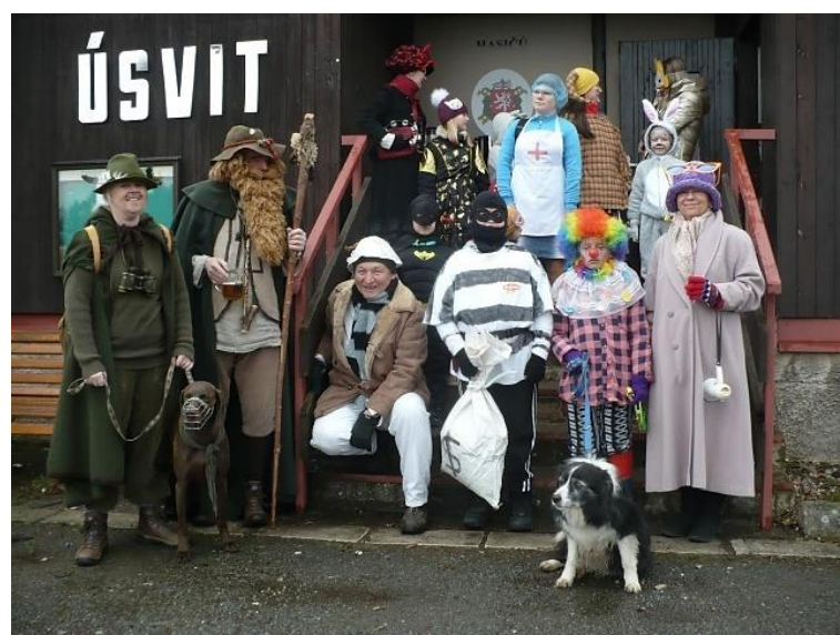
Masopust, rok 2020