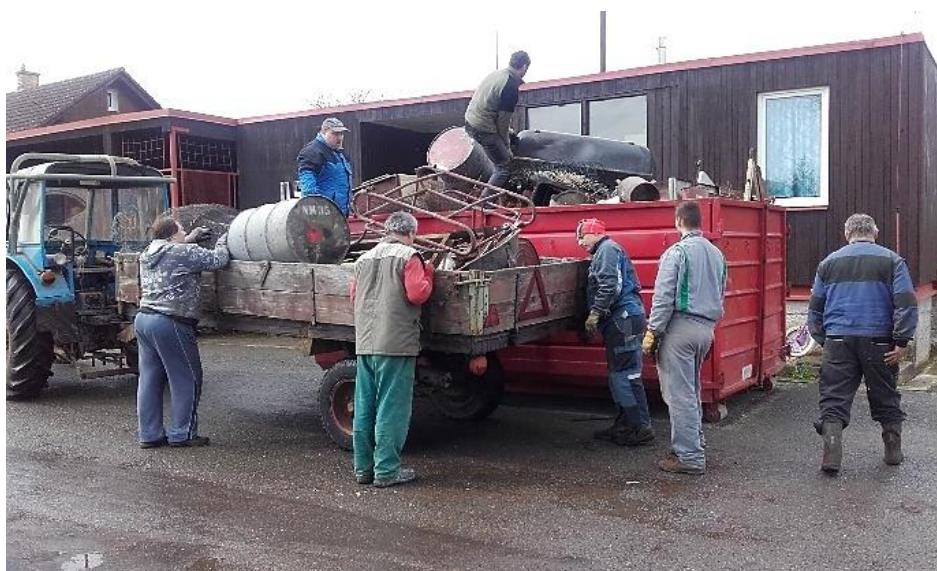
Sběr železného šrotu, rok 2016