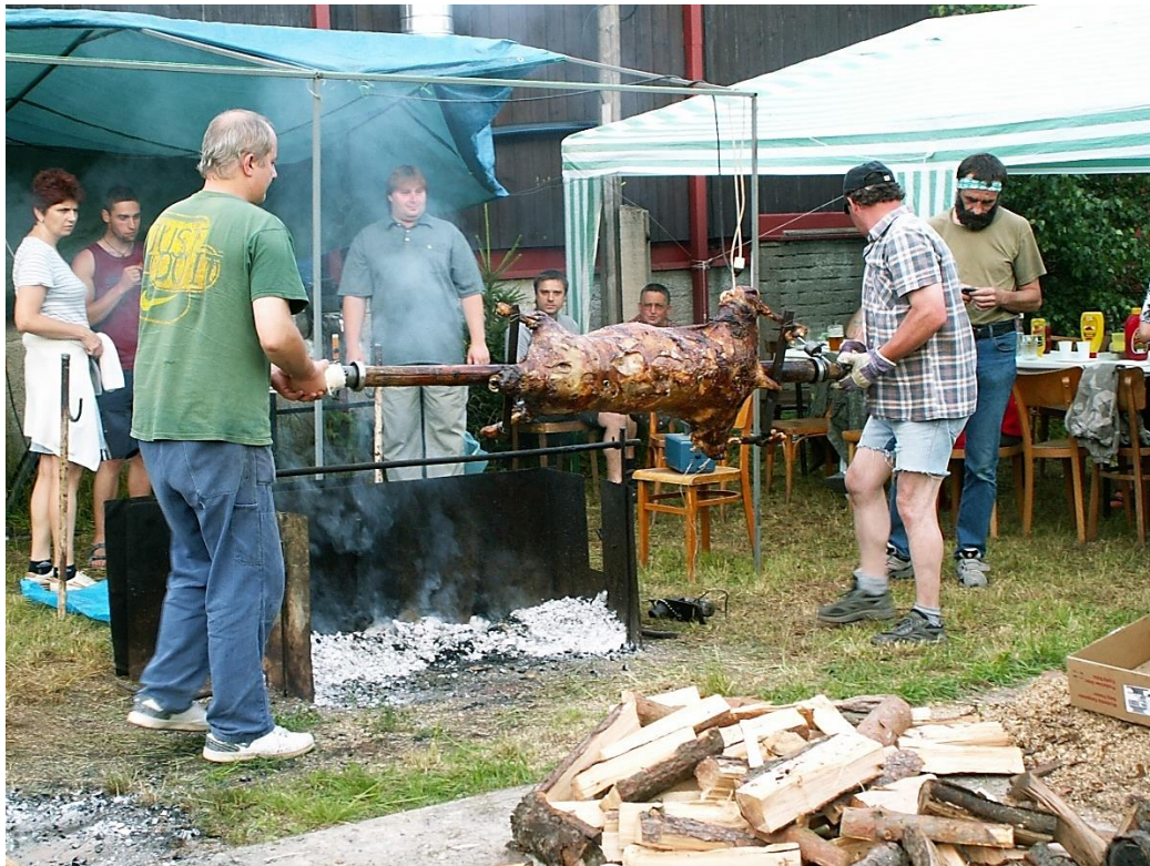
Opékání jehněte, rok 2009